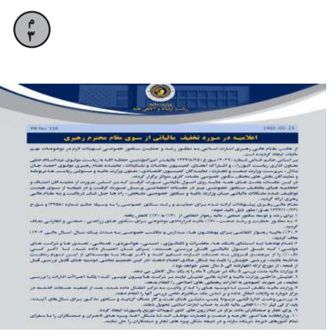
اعلامیه در مورد تخفیف مالیاتی از سوی مقام محترم رهبری