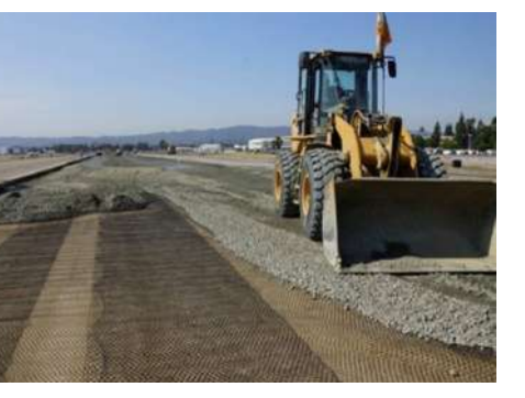
افغانستان سره بهرنی پراختیایي او بشري مرستې