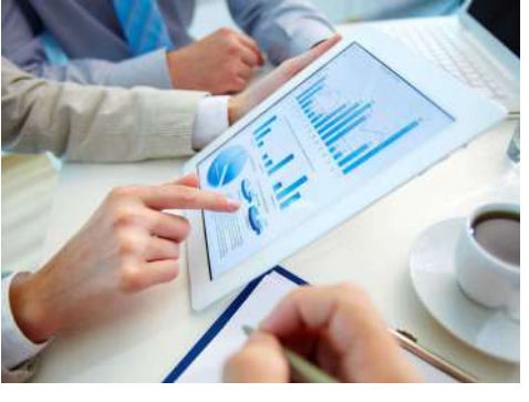
د بودیجوي واحدونو لپاره د تخصیصاتي فورم د پراوونو روزنیز ورکشاپ پیل سو