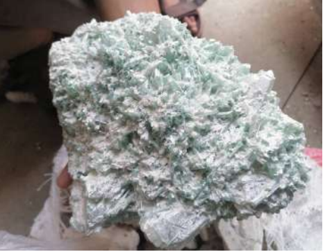
د تورخم او سپین بولدک په گمرکونو کې قاچاق کېدونکي قیمتي ډبري ونیول سوي