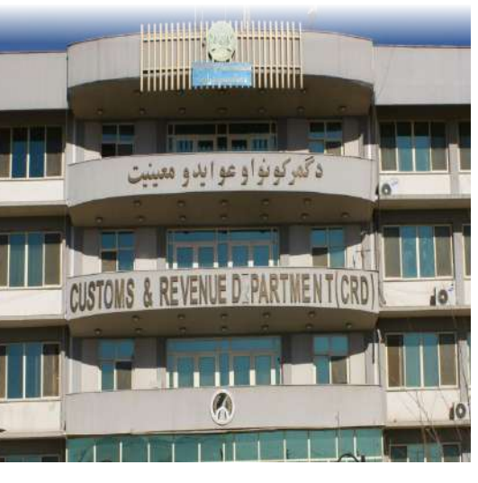
زموږ مالیه، زموږ هیواد، زموږ واکمنی

مالیات د هیواد د ملي شتمنی (بیت المال) ستره برخه، او په هیواد کې د نظام د پابینت، ټینګښت او لگښتونو د ملاتړ سرچینه ده. له همدې کبله د مالیاتي چارو شفافیت، کنټرول، معیاري کول او ارزول نه یوازې د مالیې وزارت؛ بلکې د ټولو افغانانو دیني، انساني او ملي دنده ده، چې په دغه مسؤلیت کې پراخه او مسؤله ونډه واخلي. گرانو هیوادوالو! هغه مالیه ورکونکي، چې د مالیاتي قوانینو له مخې په سم او رانه ډول خپل مالیاتي مکلفیتونه نه ترسره کوي او کوښښ کوي، چې د مالیاتو له ورکړې تېښته وکړي او یا هم د مالیاتي ادارو هغه کارکوونکي چې د اداري او مالي فساد، د قانون څخه د سرغړونو او ناقانوني کړنو لامل کېږي؛ هیله ده، چې د ذکر سوو چارو د سمون، ټینګښت او پابینت په موخه او د انساني، دیني او ملي رسالت او مسؤلیت له مخې د دغو ناکاره وگړو او د هغوی د ناقانوني کړنو په اړه د مالیې وزارت د عوایدو لوی ریاست د اړیکو نیولو د خدمتونو له مرکز (۱۰۰۰) شمېرې او یا هم له (info.ard@mof.gov.af) رسمي برېښنالیک سره د اړیکو په ټینګولو، زموږ سره خپل معلومات شریک کړئ. که چیرې تاسې د مالیې وزارت د عوایدو لوی ریاست سره د هر